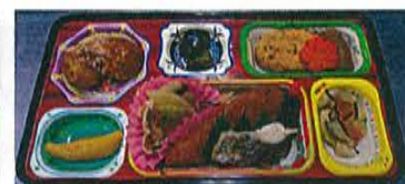
スペシャルランチ