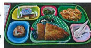
オリジナルランチ